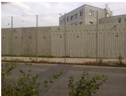
Curabilis, côté chemin d'accès

Selon nos informations, après une série de négociations menées par les services de Berne et Genève, le projet des Dardelles avance avec quelques remaniements en vue de régler le problème des SDA ; la superficie des terrains nécessaires à cet équipement serait réduite et proche de 13 hectares. Le projet de modification du régime des zones est en cours d'élaboration.