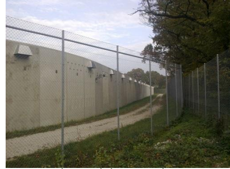
Enceinte de Curabilis, au sud