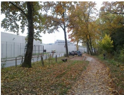
Le long du chemin de Champ-Dollon