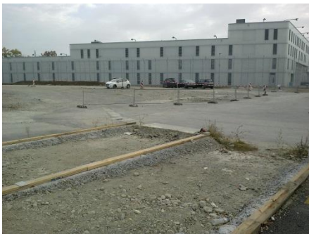
La nouvelle prison Brenaz 2, côté nord

Les personnes incarcérées à Brenaz seront des condamnés à des peines de courte et moyenne durées qui bénéficieront d'un fonctionnement progressif, différencié de leur détention : à l'entrée, phase d'accueil, puis passage au secteur d'évaluation des aptitudes pour le travail et la vie en communauté, suivi du régime ordinaire avec travail à plein temps en atelier de production ou de maintenance ; le dernier secteur en régime « ordinaire avec permissions » - toujours avec travail à plein temps - prépare les sorties, pour des formations à l'extérieur et le passage dans un établissement ouvert. C'est la grande nouveauté de cette réalisation, ainsi que l'a souligné, lors de son inauguration, le nouveau directeur général de l'OCD, Philippe Bertschy, à savoir permettre « de concrétiser l'esprit du Code pénal » dans la sens de la réinsertion des détenus.