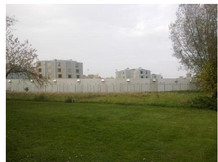
Curabilis, côté village de Puplinge