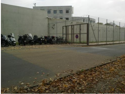
Enceinte de la cité carcérale, côté accès

double rangées de grillages parfois rehaussés de barbelés ; et, au sein du périmètre carcéral, de très hauts mâts d'éclairage côtoient les masses bâties des différentes prisons, dont les toits sont surmontés encore de projecteurs. Un camp retranché qui, paradoxalement à l'interne, duplique autour de chaque prison murs, clôtures et barbelés. De nuit, la cité brille de tous ses feux : une « débauche de lumières » qui conduit les villageois à qualifier ironiquement cette cité de « Quatre étoiles ». Et de nous poser la question : les détenus peuvent-ils dormir malgré cette illumination ?