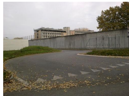
En arrière-plan la prison de Champ-Dollon