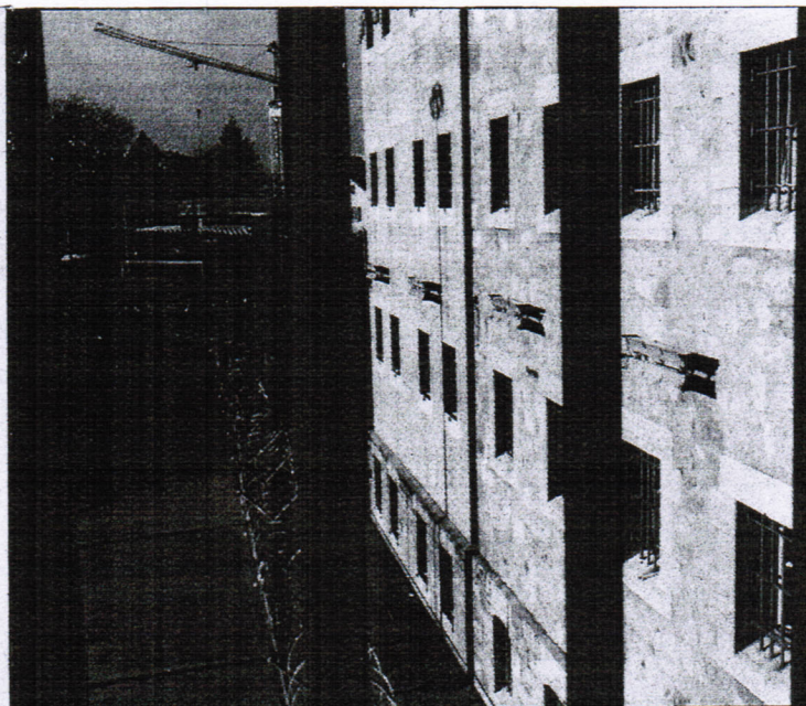
A Bois Mermet, la situation carcérale est problématique. VERISSIMO

tachement d'action rapide et de dissuasion) a été appelée à la rescousse. Les principaux meneurs de l'action de protestation ont été transférés dans d'autres établissements de détention préventive de Suisse romande et seront sanctionnés. Quelle est la raison de cette colère et de cette désobéissance aux injonctions du personnel surveillant? Les détenus ont manifesté pour exprimer des revendic-